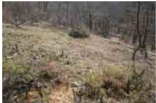
Point n° 4 : après chantier