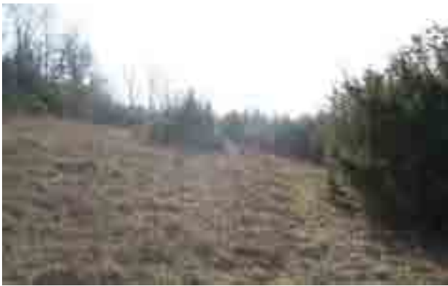
Point n° 3 : avant chantier