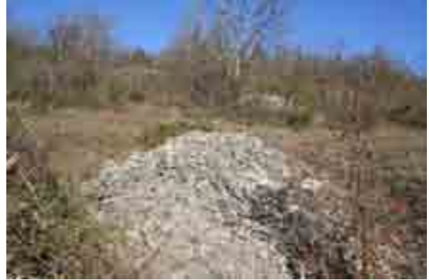
Point n° 6 : après chantier