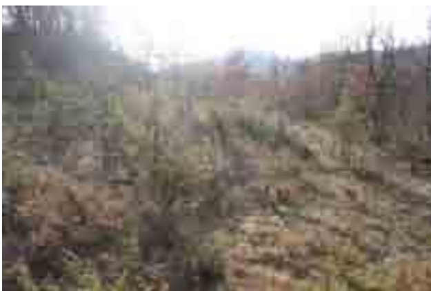
Point n° 5 : avant chantier