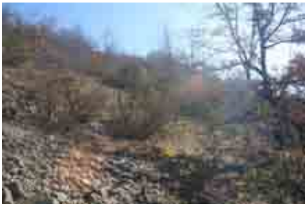
Point n° 7 : avant chantier