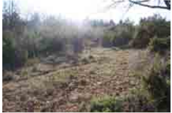
Point n° 9 : après chantier