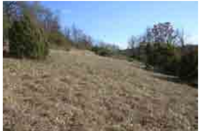
Point n° 3 : après chantier