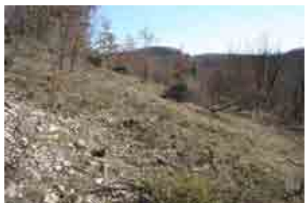
Point n° 5 : après chantier