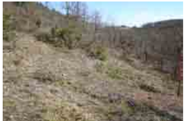
point n° 7 : après chantier