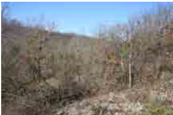
Point n° 8 : avant chantier