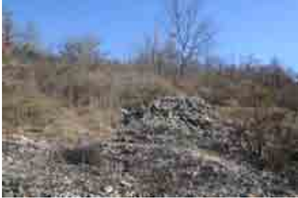
Point n° 6 : avant chantier