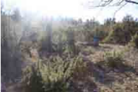
Point n°9 :avant chantier