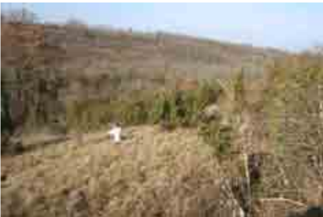
Point n° 2 : avant chantier