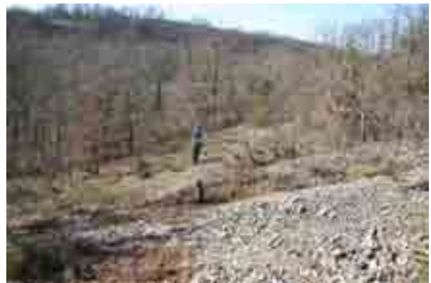
Point n° 8 : après chantier