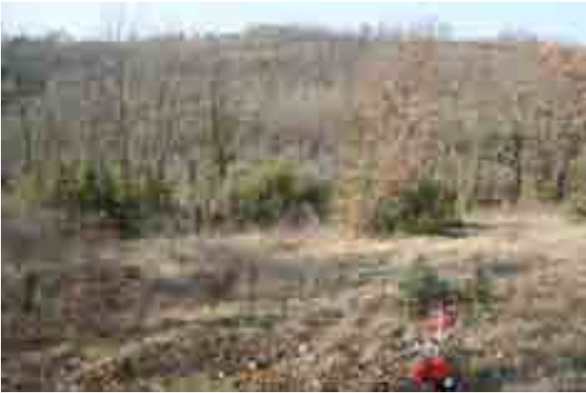
Point n° 1 : avant chantier