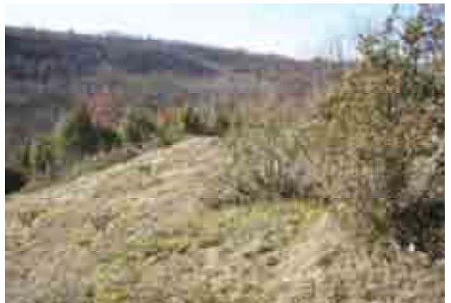
Point n° 2 : après chantier