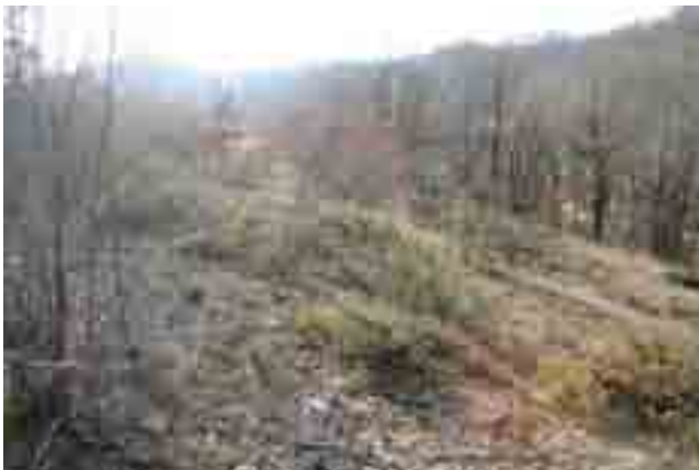
Point n° 4 : avant chantier