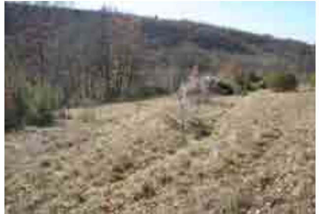
Point n° 1 : après chantier